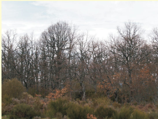
Reboleira no Marizo de Trevinca.

Mazáns de cuco, unha formación producida por un insecto.