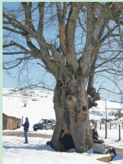
Carba da Praza do Campo. Quindous. (Cervantes-Lugo). Ten 21 m de altura e 250 a 500 anos

As landras son pequenas, de 1,5 a 2 cm de longo e sen rabo.