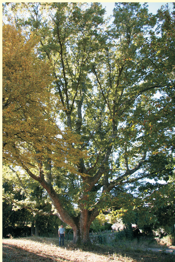
Cerquiño do Pazo da Pena (Rozobales-Manzaneda). O máis grande de Galicia, con 27 m de altura.