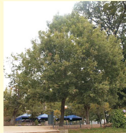
Caxigo na Alameda de Pontevedra.